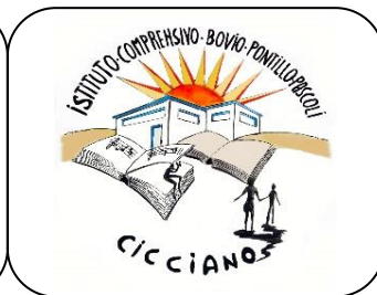
IST. COM.VO CICCIANO "Bovio-Pontillo-Pascoli"