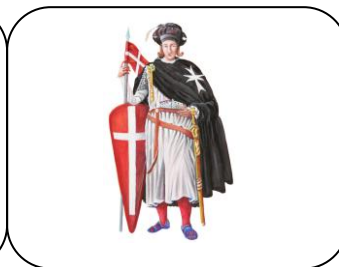
Associazione PRO LOCO CICCIANO