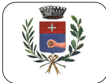
Assessorato P.I. COMUNE DI CICCIANO